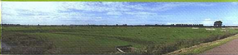
De Hekslootpolder gezien in de richting Haarlem-Noord

De wegen van en naar Haarlem liggen vanouds voornamelijk in noord-zuidrichting. Er zijn betrekkelijk weinig oost-west georiënteerde wegen en paden. Een paar van deze fraaie en rustige dwarsverbindingen zijn heel geschikt als recreatieve routes voor fietsers en wandelaars. Het is van groot belang dat deze verbindingen worden behouden, verbeterd of in ere hersteld. Het Slaperdijkpad begint bij de duinen in Santpoort-Zuid in het westen en eindigt in het oosten bij Spaarndam en het Spaarne.