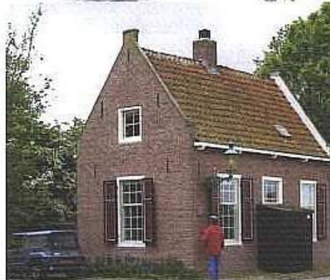
De Haarlemmersluis in Spaarndam rond 1900 en daaronder het Tolhuis (1824-1825)