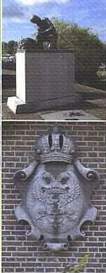
De Westkolk in Spaarndam