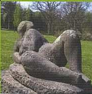
Het beeld Liggende Vrouwenfiguur in het Wethouder Laanpark.