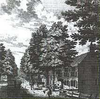
Huize Oosterduin, 1794.