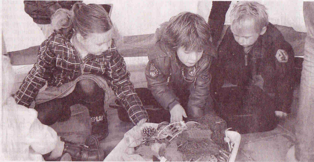
Kinderen vol overgave bezig met 'Wat zit er allemaal in die doos'.