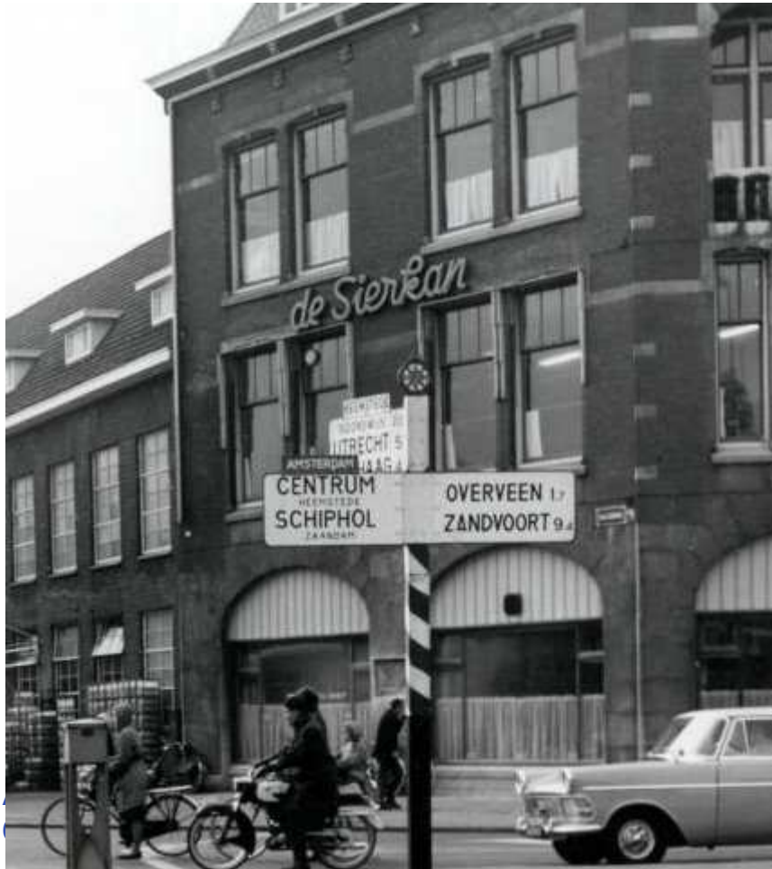
Haarlemsche Melkinrichting 'De Sierkan'. De school St. Antonius. In deze school is de school van de Melkinrichting 'De Sierkan'. Nederland circa 1960.