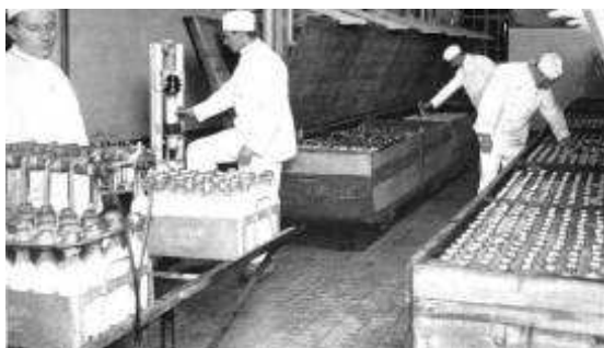
In 1904 kon De Sierkan dankzij een eigen uitvinding 24 flessen tegelijk vullen met melk. De beugeldoppen moesten met de hand worden gesloten. Negen man vulden op deze manier 2000 flessen per uur.

Een eigen uitvinding uit 1904 zorgde ervoor dat er 24 flessen tegelijk en automatisch konden worden gevuld! Vullen, sluiten en pasteuriseren vergde verder nog veel afhandelingen: 9 man met een vulsnelheid van 2000 flessen per uur. De beugels moesten met de hand gesloten worden en de flessen daarna van een sluitingsetiket voorzien. In vergelijking daarmee gebeurde het in 1962 heel anders: 28.500 flessen werden geheel automatisch gevuld en met capsules gesloten, pasteurisatie vond plaats vóór het vullen. Dat aantal gold per uur! De productie omvatte in 1962 de volgende zuivelproducten: dagmelk, yoghurt, room, karnmelk, chocolademelk, pappen en vla's. Per dag werden er 225.000 stuks zuivelproducten verwerkt!