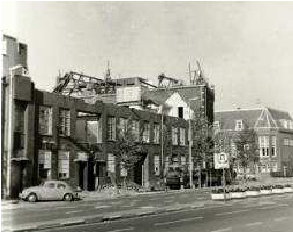
Sloop van het deel langs de Zijlsingel. Rechts is nog het gebouw van Sociëteit Vereeniging te zien.