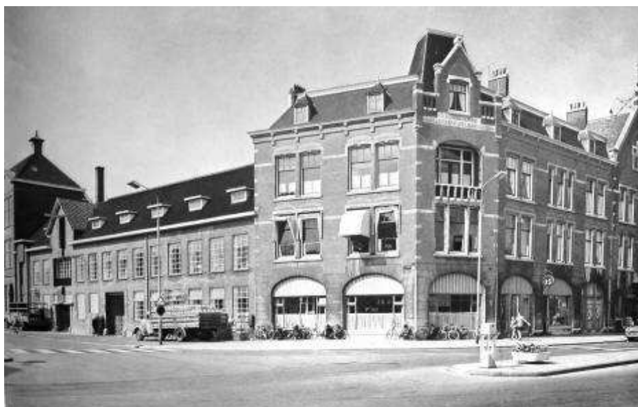
Deze afbeelding laat duidelijk zien dat De Sierkan een omvangrijk gebouwencomplex bezat aan de Zijlweg hoek Zijlsingel. Vandaag de dag is hier de Publieksdienst van de Gemeente Haarlem te vinden, in een modern kantoorgebouw.