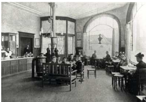
In 1904 nog een bijzonderheid: een glaasje melk drinken in de salon van De Sierkan.

Vandaag de dag kunnen we ons amper voorstellen dat de kruising Zijlweg, Kinderhuissingel en Zijlsingel er ooit zo rustig heeft bijgelegen. Rechts de boerderij die stond op de plek waar vandaag de dag Sociëteit Vereeniging staat.