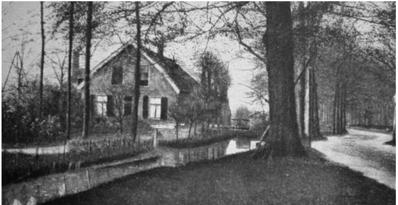
De Sierkan had in de Haarlemmerhout een eigen boerderij, "Oosterhout" waar eigen koeien en geiten voor melk zorgden.

Al snel kreeg De Sierkan een eigen boerderij: "Oosterhout", gelegen in de Haarlemmerhout. Op de 8ha weiland werden 9 koeien met een waarde van Hfl 2.510,14 en 2 geiten met een waarde van slechts Hfl 17,75 geweid. De melk van deze boerderij werd onder bijzonder hygiënische omstandigheden gewonnen en stond onder scherp medisch toezicht. De hoenderen leverden bovendien eieren en er kwam een melktuin waar men zich op zonnige zomerse dagen aangenaam kon verpozen! De speciaal gewonnen melk, van TBC-vrije koeien, werd als zogenaamde "Kindermelk" in de handel gebracht. Na 1910 werd de "Cruquius-boerderij" in de Haarlemmermeer ook aan het eigen bezit van De Sierkan toegevoegd.