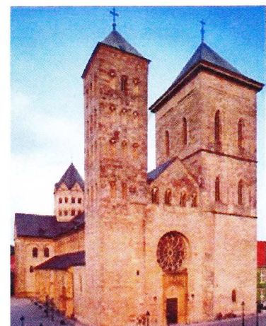
Dom St. Petrus

Historische Vereniging Haarlem op bezoek in Osnabrück 15. t/m 17. april 2011