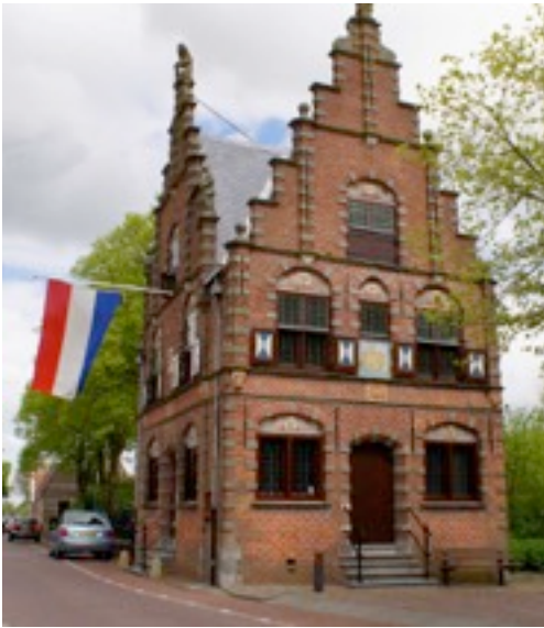
Huidige Raadhuis zuid-westgevel

Voorafgaand aan een middag excursie op 20 maart jl. naar de Cono-fabriek in West Beemster jl. hielden een tiental leden van de werkgroep Gebouw en Omgeving een stop in Graft om het Raadhuis, de ernaast gelegen Zerkenvloer en de aangrenzende tuinderij annex camping Welgelegen te bezoeken. Drie in elkaars nabijheid gelegen objecten elk met een eigen gezicht en verhaal.