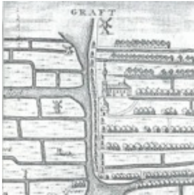
Fragment uit de kaart van Graft door J.A. Leeghwater (1649)