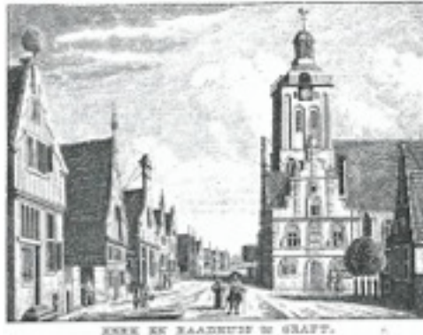
Gravure Karel Bendorp (plm. 1787)