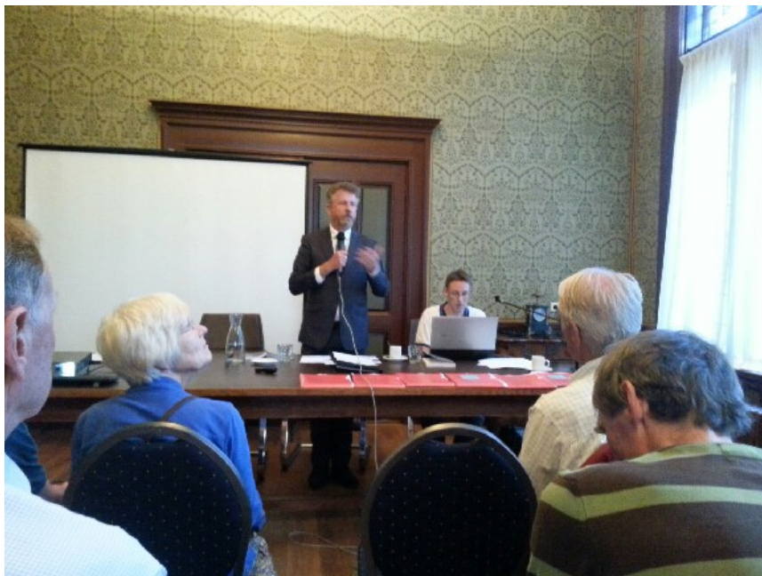
Afbeelding 1: Welkom door de voorzitter