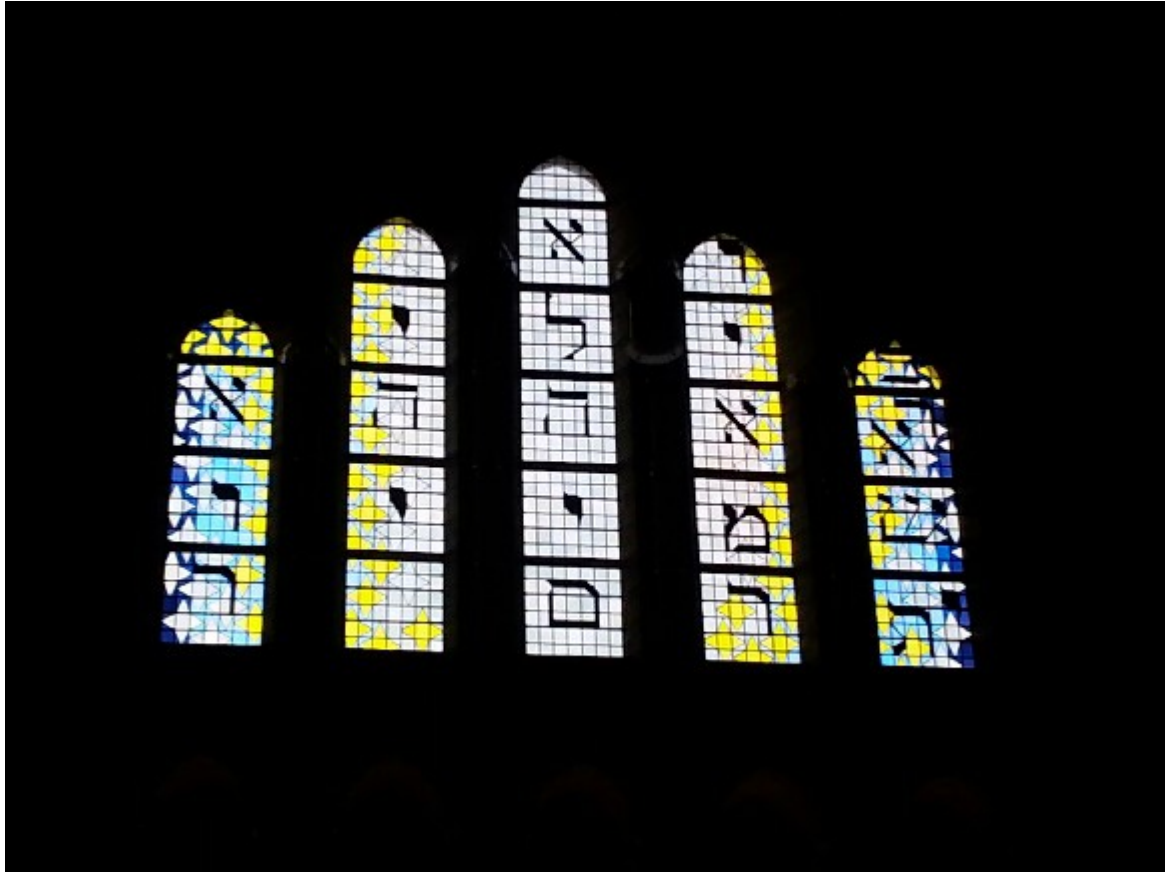
Afbeelding 5: Glas-in-loodramen van Jan Dibbets