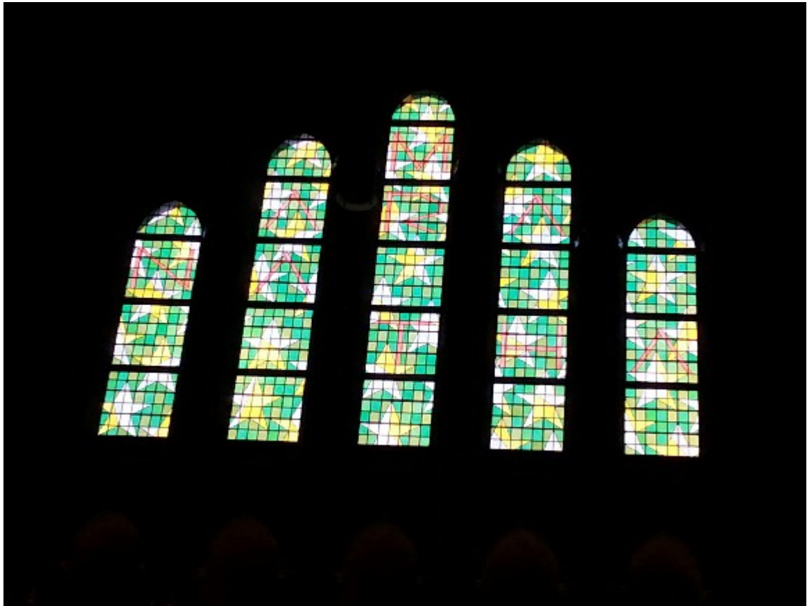
Afbeelding 6: Glas-in-loodramen van Jan Dibbets