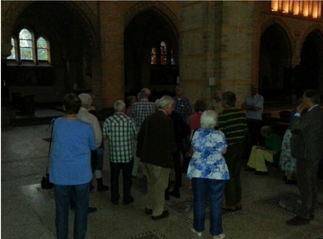
Afbeelding 7: Een rondje door de kerk